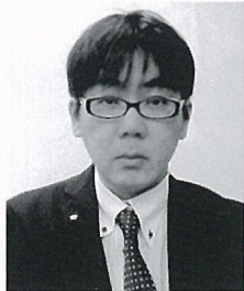
(株)愛媛CATV常務取締役