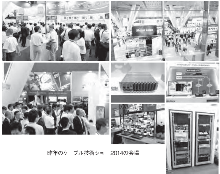
昨年のケーブル技術ショー 2014の会場

6月10日(水)・11日(木)に東京国際フォーラムで開催される「ケーブルコンベンション2015」とその関連イベント「ケーブル技術ショー2015」。今回はFTTH、無線、4K/8Kなどの最新製品や関連セミナーが集結するはずだ。合計69社・65ブースが出展するケーブル技術ショー2015の各出展企業の展示場所が決まった(下記会場図)。本誌では今号と次号7月号の2号にわたって、今年の注目ブースの内容を詳しく紹介する。今号では会場最大の18小間で大規模展示を行うミハル通信の中心となる展示製品と導入事例を掲載した(22~25頁)。(渡辺 元・本誌編集部)