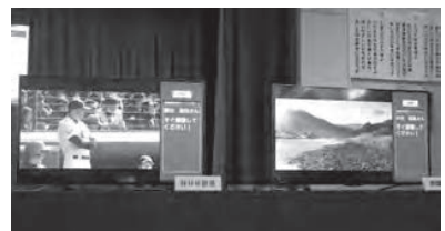
左がNHK徳島放送局の画面、右が四国放送の画面。同時に避難指示が表示された