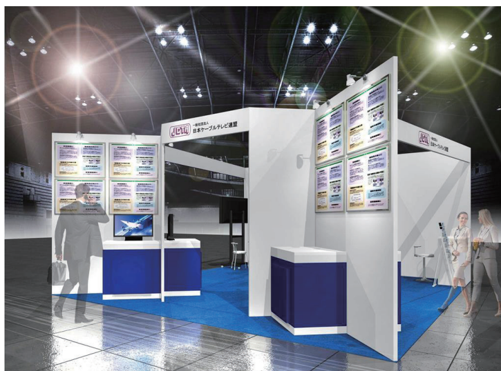
日本ケーブルテレビ連盟展示ブースのイメージ

そして「地域振興」では、JCTAや日本デジタル配信(JDS)、東京ケーブルネットワーク、ニューメディア、スターキャットが取り組み中の事例を紹介。業界の新番組「おまつりニッポン」の紹介ビデオや360度ビューイングのデモ展示も体験できる。